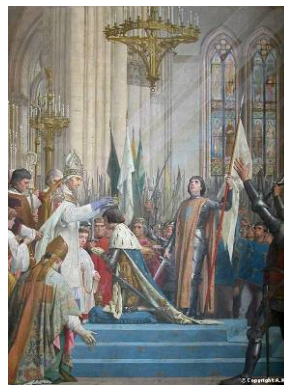
Sainte Jehanne d'Arc à Reims lors du sacre du Roi

Effectivement, nous ne sommes que Ses gouvernés, Ses sujets, Ses serviteurs. Ce n'est pas nous qui restaurerons la France. Nous nous devons seulement, humblement, d'être des sujets fidèles, vertueux, de ce Grand Roi.