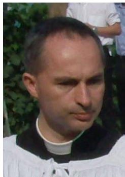
Abbé de Cacqueray

Et je demande aux hommes : mais pourquoi celui qui a osé tremper dans le bain de son urine l'image d'un autre homme a-t-il choisi que cette image soit celle d'un homme juif ? Cette race n'a-t-elle pas suffisamment souffert ? N'a-t-elle pas été suffisamment brimée et humiliée ? Pourquoi s'en prendre encore à l'un de ses membres ? Et comment est-il possible que l'image de cet homme juif , plongée dans le bain d'urine où l'y a placée la main d'un autre homme, puisse être considérée comme un chef d'œuvre et faire le tour de la terre ? ».