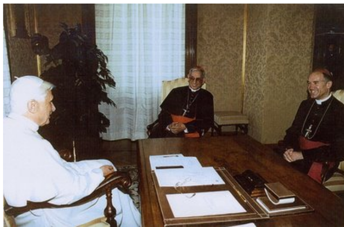
29 août 2005 : Mgr Fellay en extase devant le "serpent".

« Monseigneur Lefebvre a été la vigie au service de l'Église catholique. Après sa mort, au début des années 90, il n'y a pas eu un remplaçant ayant les mêmes valeurs que cet homme-là. Et malheureusement au sein des catholiques traditionalistes, il y a des infiltrés, des personnes qui ne sont pas nettes. Vous savez, c'est révélateur : Mgr Lefebvre avait une expression pour parler du cardinal Ratzinger puisqu'il a dialogué avec lui, il a discuté avec lui. Jean-Paul II envoyait son cardinal, le cardinal Ratzinger. Et le surnom que donnait Mgr Lefebvre au Cardinal Ratzinger, futur Benoît XVI, c'était le serpent. Ça, je le sais de source sûre. » 2