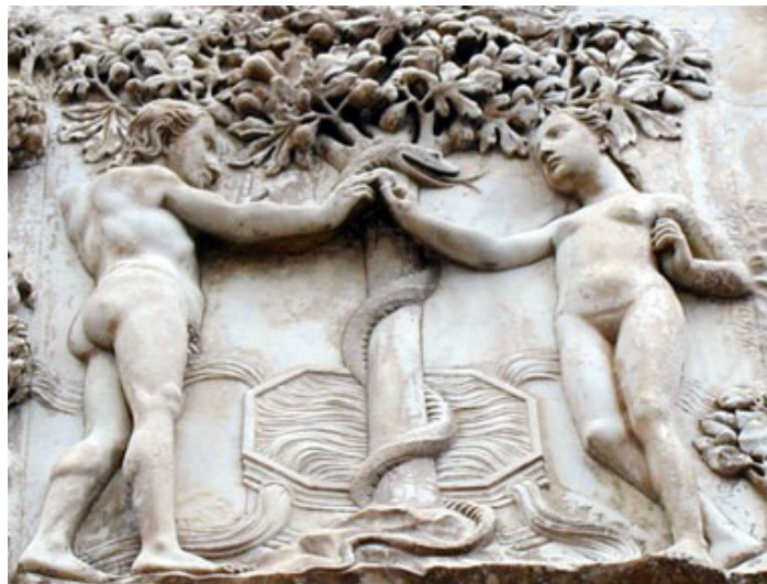
Adam et Ève, et le serpent au paradis terrestre, façade de la cathédrale d'Orvieto, Italie, vers 1320-1330.

Ces trois faits (nous pourrions en ajouter bien d'autres) nous montrent que Benoît est resté le « serpent ». Voir Mgr Fellay émerveillé, tel un enfant ouvrant son cadeau d'anniversaire, en déclarant que Benoît XVI appelle Mgr Lefebvre « un grand homme de l'Église catholique » est proprement navrant. Quelques belles paroles suffisent à impressionner Mgr Fellay alors que les actes répétés de Benoît XVI démontrent que ce dernier agit à l'opposé de Mgr Lefebvre, imposant sans relâche, le faux œcuménisme, la fausse liberté religieuse...