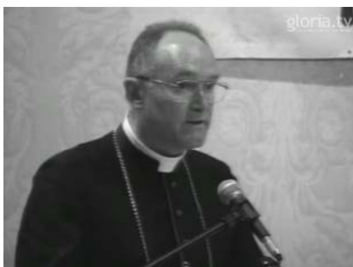
Mgr Fellay – Kansas City – Octobre 2010

La conférence de Mgr Fellay est disponible sur le site internet 1 de la FSSPX aux USA. Elle est découpée en 7 vidéos. Nous nous intéressons ici aux 12 premières minutes de la sixième vidéo.