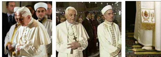
Benoît XVI en prière dans la mosquée bleue d'Istanbul où il avait chaussé des babouches turques !

Non. Il venait de lancer sa première « croisade » (?) pour demander la « libéralisation de la messe de Saint Pie V » (?)... Il ne fallait donc pas déplaire au Vatican !