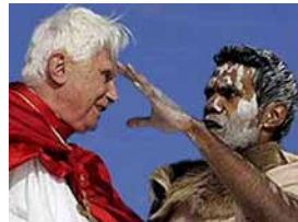
Benoît XVI se fait bénir par un sorcier en Australie en juillet 2008