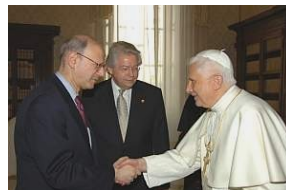
Benoît XVI reçoit en décembre 2006 le président du B'nai B'rith, organisation maçonnique internationale exclusivement réservée aux juifs

Mgr Fellay paraît faire siennes les paroles de Jean XXIII qui, au moment de Vatican II, déclarait : « les temps ne sont plus aux condamnations » !