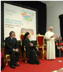
Réunion inter-religieuse du 21 octobre 2007 à Naples

D'autres images de la « restauration de l'Eglise » entreprise par le « pape providentiel » :