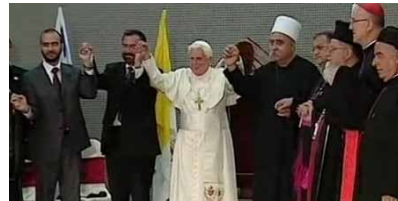
Mai 2009 : une danse œcuménique à Nazareth, entre un rabbin et un mufti...