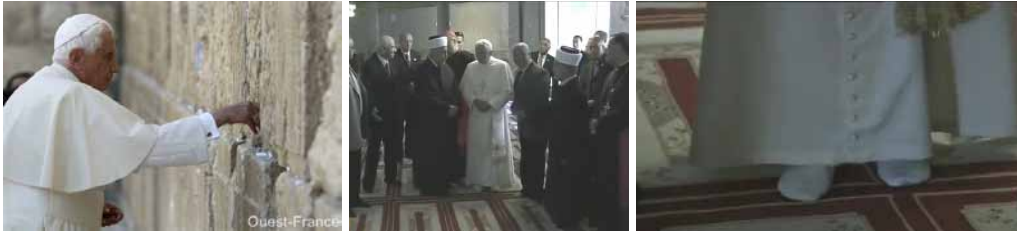
Au mur des lamentations et à la mosquée d'Omar, « lieu sacré » pour Benoît XVI où il s'est déchaussé !

Non. Il a déclaré qu'il s'agissait d'une « grâce » du Ciel !