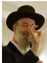
Le rabbin Yona Metzger pleinement satisfait de l'engagement pris par Benoît XVI en Israël de renoncer à convertir les juifs !

Non. Mgr Fellay venait d'être « gracié » par Benoît XVI.