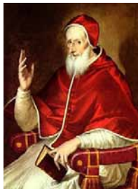
Saint Pie V

Dans l'église conciliaire, la messe de Saint Pie V demeure donc strictement réglementée et soumise à plusieurs conditions alors que, par la Bulle Quo Primum tempore qui codifie jusqu'à la fin des temps le Très Saint Sacrifice de la Messe et tout spécialement son Canon, Saint Pie V donnait à tous les prêtres la pleine liberté d'utiliser ce Missel : « librement et licitement, et cela à perpétuité » !