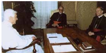
Le 29 août 2005 à Castel Gandolfo, Mgr Fellay subjugué par Ratzinger