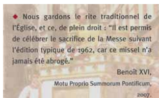
Citation modifiée sur le tract de la Fête-Dieu 2008 à Toulouse

A dessein, dans ses écrits, la FSSPX met en exergue une citation trompeuse du Motu proprio :