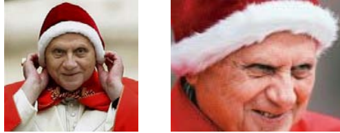
Le très précieux mais non moins rusé Benoît XVI coiffé du camauro, sur la place Saint Pierre, le 08 décembre 2005

Le très malin Ratzinger savait que la simple annonce du Motu Proprio agirait comme un cheval de Troie. Elle permit de polariser toute l'attention des supérieurs de la FSSPX vers ce simple morceau de papier qui allait se révéler être une nouvelle tromperie. Elle légitima l'activisme débordant des infiltrés à la tête des médias de la FSSPX et elle créa artificiellement un climat psychologique dans lequel ont baigné les fidèles et qui les a conditionné dans cette seule perspective : quand allait sortir le Motu Proprio ?